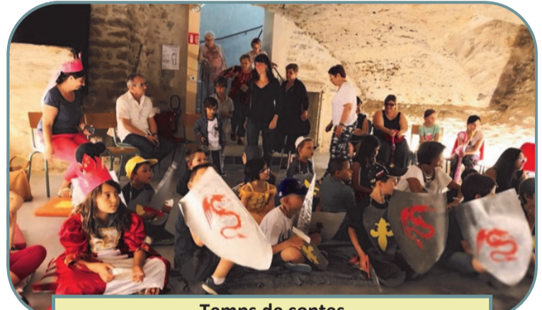
Temps de contes Bibliothèque de Villebois

Planning des activités et agenda des manifestations consultables sur le site de l'association.