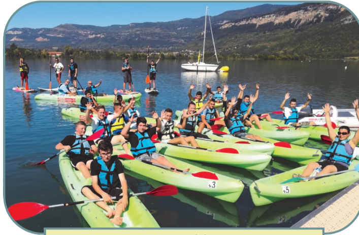
Avec les élèves du CFA de Montalieu-Vercieu

Du côté de l'aviron ça rame fort avec un nouveau créneau le dimanche matin de 9h15 à 12h en plus du samedi matin de 9h45 à 12h. Les adhésions sont ouvertes pour la saison 2019.